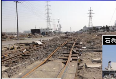
仙台塩釜港中野地区