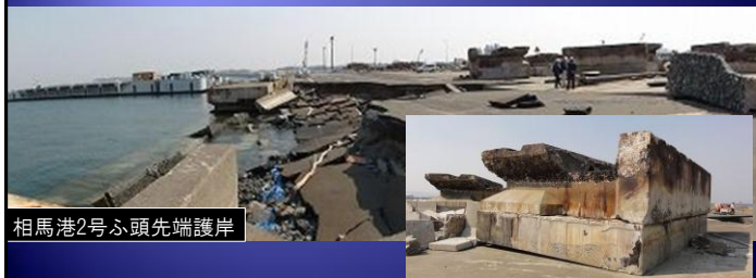
相馬港2号ふ頭先端護岸