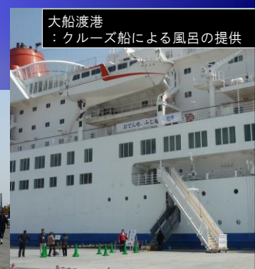
大船渡港 ：クルーズ船による風呂の提供