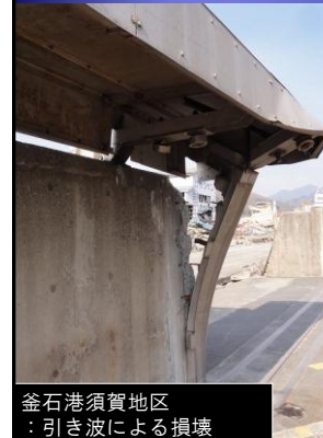
釜石港須賀地区 ：引き波による損壊