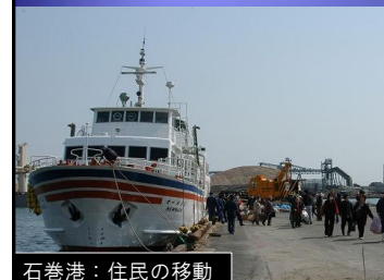
石巻港：住民の移動